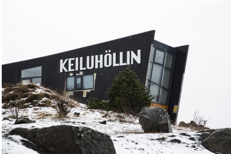
Eignarhaldsfélag keiluhallarinnar í þrot